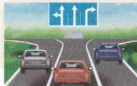
left; straight; right