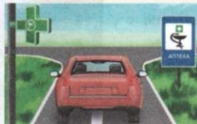
on the left; on the right